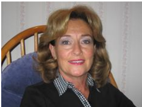
Keren Kajemet Finland ry

Am Israel Chai - Eläköön Israelin kansa!